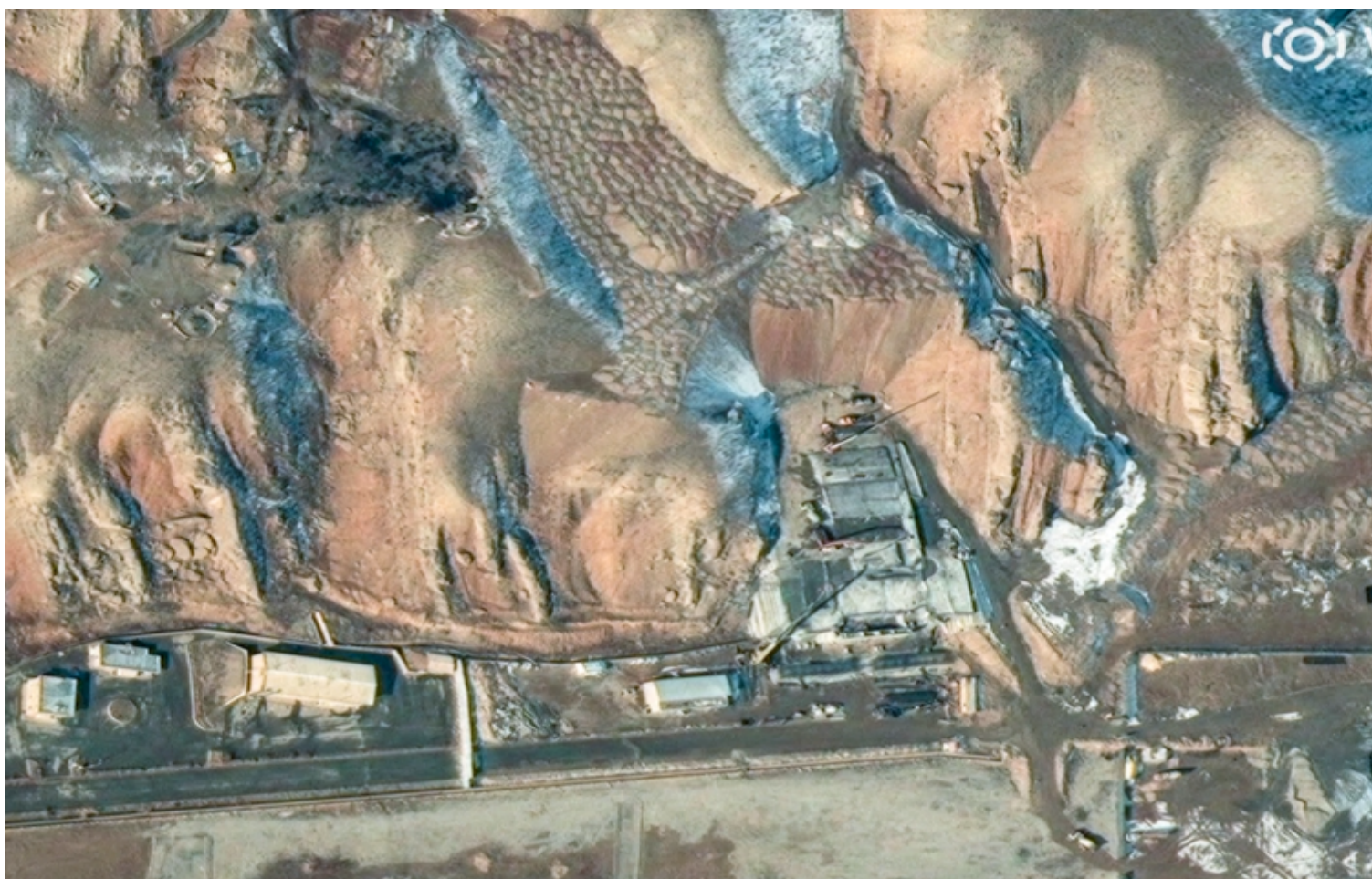
Foto de satélite mostra início de construção em concreto no complexo militar de Parchin, no Irã

"A instalação pode em breve se tornar um bunker completamente irreconhecível, oferecendo proteção significativa contra ataques aéreos", alertou o presidente do ISIS, David Albright, em uma publicação na rede social X.